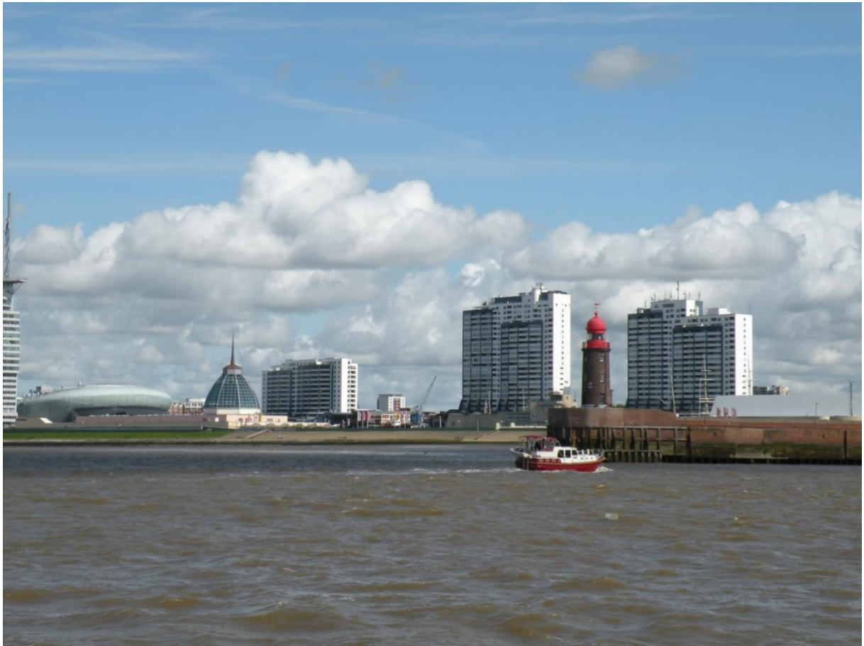
Blick von der Weser auf das Haus links vom Leuchtturm, Schwimmbad in dem 25. Stock